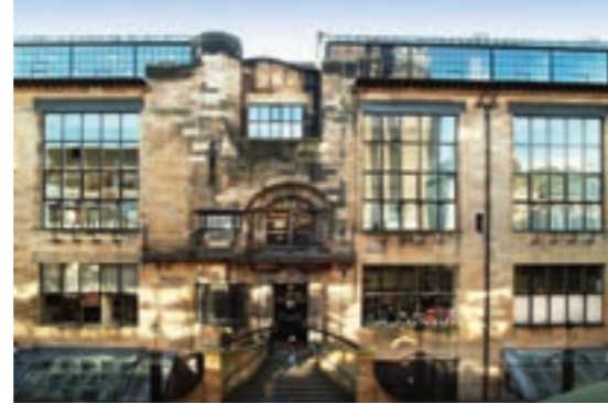
The Glasgow School of Art Mackintosh Building