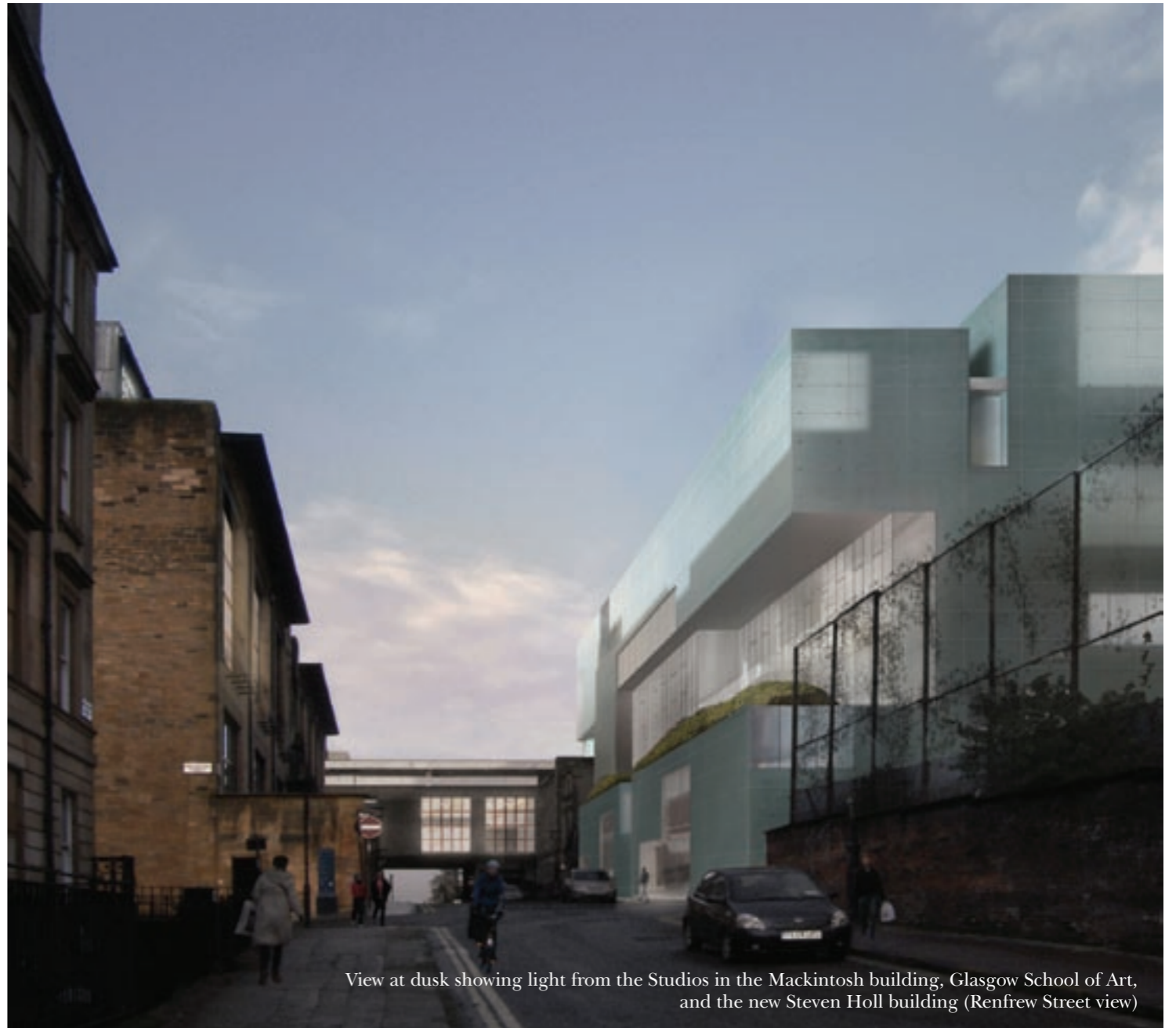
View at dusk showing light from the Studios in the Mackintosh building, Glasgow School of Art, and the new Steven Holl building (Renfrew Street view)

FIONA HYSLOP Ministro per la Cultura e gli Affari Esteri del Governo Scozzese