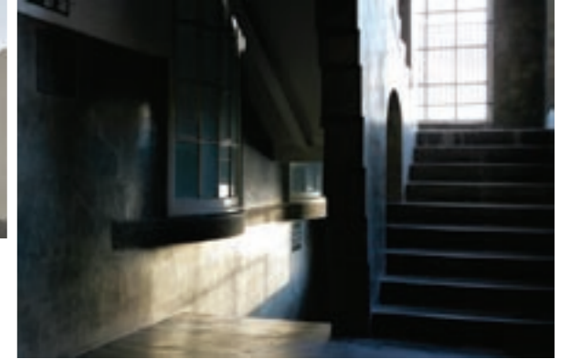
Mackintosh building (interior)

The Scottish Government & Creative Scotland in partnership with the British Council have invited NVA to represent Scotland at the 12th International Architecture Exhibition at the Venice Biennale. Comprising a series of events, the presentation will take place during the Biennale's final weekend, the 20 and 21 November 2010.