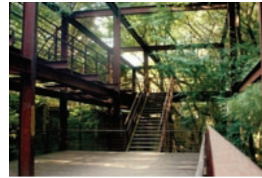
Parque da Juventude, Sao Paulo, Brazil, 2004

La giustapposizione fra un edificio radicale del XX secolo e un paesaggio romantico progettato in stile vittoriano porta ad un percettibile contrasto di culture, dato che la "dichiarazione architettonica" urbana si staglia enfaticamente contro le antiche forme "naturalizzate" della tenuta. La tensione che ne risulta è eccitante, stimola il pensiero ed è capace di suscitare forti emozioni a favore o contro la sua presenza.