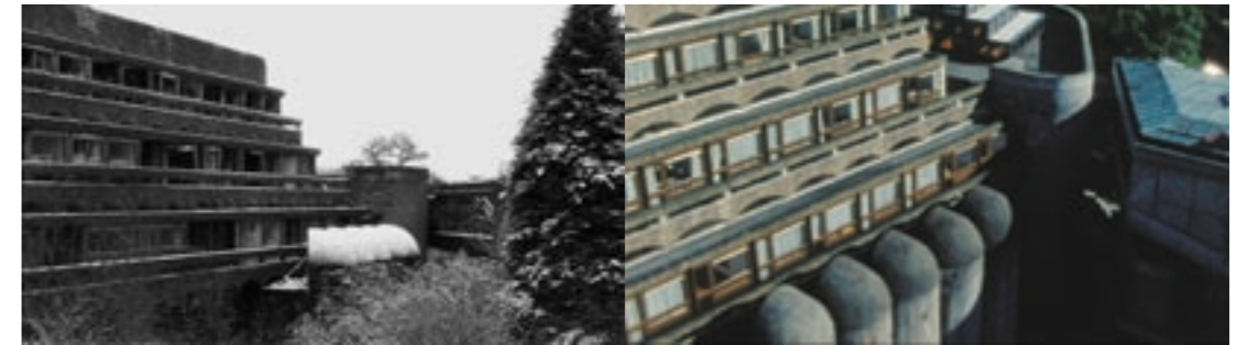
'Space and Light Revisited' (film stills) 1972 & 2009

La Chiesa ed il campanile di East Kilbride, fuori Glasgow, erano al tempo senza rivali in Gran Bretagna e, assai più tardi, la stessa qualità della massa scultorea e la vivacità imprevedibile dei dettagli si ritroveranno nel seminario presso Cardross. I loro edifici erano seri, pieni di passione e assolutamente memorabili.