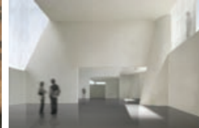
new building (interior)