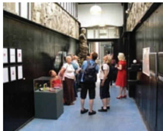
Public tour of The Glasgow School of Art

Si tratta di un'idea con un pedigree nella stessa Venezia. Negli anni '60 l'architetto Carlo Scarpa si occupò dei vari monumenti atrofizzati sovrapponendo frammenti modernisti - ausili sgradevoli di sua invenzione - alle loro carcasse classiche. Noi siamo oggi liberi di "abitare" e vagare nello spazio fra le due dimensioni, senza vincolarci ad alcuna di esse. Forse un giorno, qualcun'altro aggiungerà frammenti creati da lui medesimo ai collages di passato e presente di Scarpa.