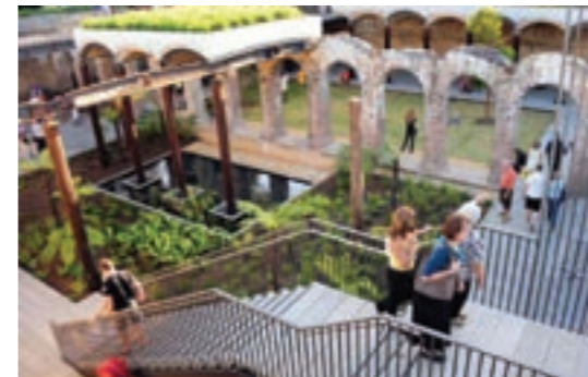
The sunken garden, Paddington Reservoir Gardens, Sydney, Australia, 2009

Our approach is to combine challenging art with an engaged public to encourage new ways of thinking around this highly contested site. Local and national aspirations are approached simultaneously to embed the plans within a geographical area while acknowledging its importance to wider communities of interest.