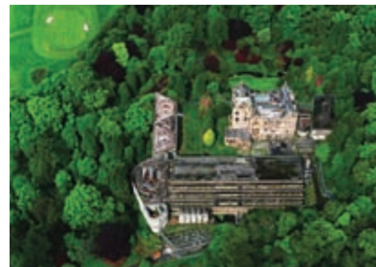
Kilmahew estate / St Peter's seminary aerial view

The juxtaposition of a radical twentieth-century building and a romantic Victorian designed landscape leads to a perceptible clash of cultures, the urban architectural statement laying itself out with dramatic intent within the older 'naturalised' forms of the estate. The resulting tension is exciting, thought-provoking and capable of raising strong emotions for and against its presence.