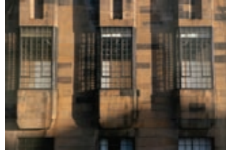
Mackintosh building exterior detail