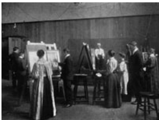
Glasgow School of Art; One of the Life Rooms, 1900

È una posizione scomoda. Il cambiamento è imprevedibile e lo è sempre stato. Gli architetti potranno magari sperare di predire che cosa avverrà alle loro creazioni nel breve termine, ma per ciò che riguarda la "longue durée" nessuno sa che cosa succederà. Le intenzioni architettoniche sono un po' come scoprire le prime tracce di un cadavere squisito: incomplete, contingenti e gravide di possibilità.