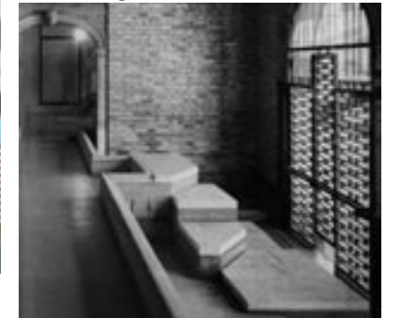
Fondazione Querini Stampalia, Carlo Scarpa 1961

But the pedigree is much older than that. Venice was founded when the citizens of Roman Aquileia faced barbarian attack. They knew they wouldn't be able to keep their venerable buildings the way they were. Like the architecture student, they ripped them to pieces and floated them out into the lagoon. They bound the fragments together with iron and stayed them with timber, and they are still there. The city was only ever an unsightly aid, an altered state, obliged to alter again, or, if not, to become a shadow on the mirage of a lagoon.