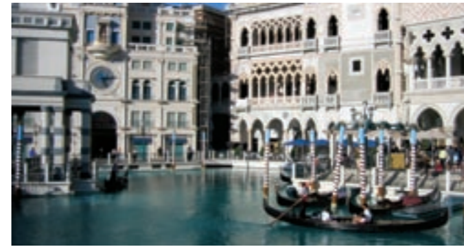
The Venetian Hotel, Las Vegas