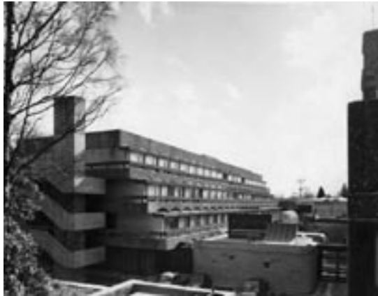
St Peter's seminary in 1972