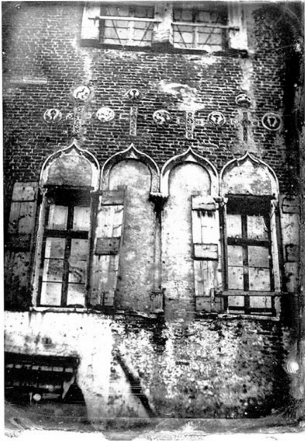
Casa degli Zane, Venice, 19th century

Outside the student's window was another masterpiece in crisis. Charles Rennie Mackintosh's Glasgow School of Art was built as an art school, but it's become an icon, and the requirements of the two don't match. Art is a messy, toxic, noisy business – one ill suited to guided tours and the contemplation of the connoisseur; and while St Peter's may be subject to the laws of entropy, the art school is falling prey to atrophy. Soon enough it'll have to be turned into a museum.